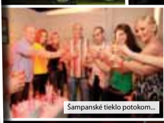
Šampanské tieklo potokom...