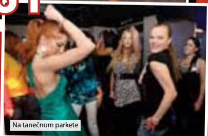
Na tanečnom parkete