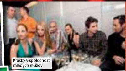
Krásky v spoločnosti mladých mužov