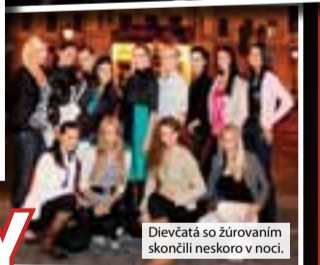
Dievčatá so žúrovaním skončili neskoro v noci.