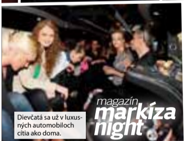
Dievčatá sa už v luxusných automobiloch cítia ako doma.