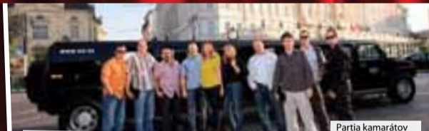
Partia kamarátov sa teší na veľký žúr.