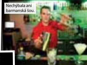
Nechýbala ani barmanská šou.